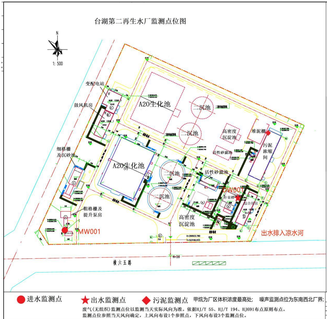
图 1 监测点位图